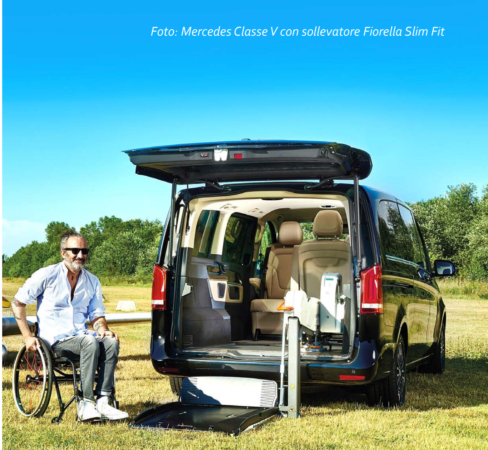
Foto: Mercedes Classe V con sollevatore Fiorella Slim Fit