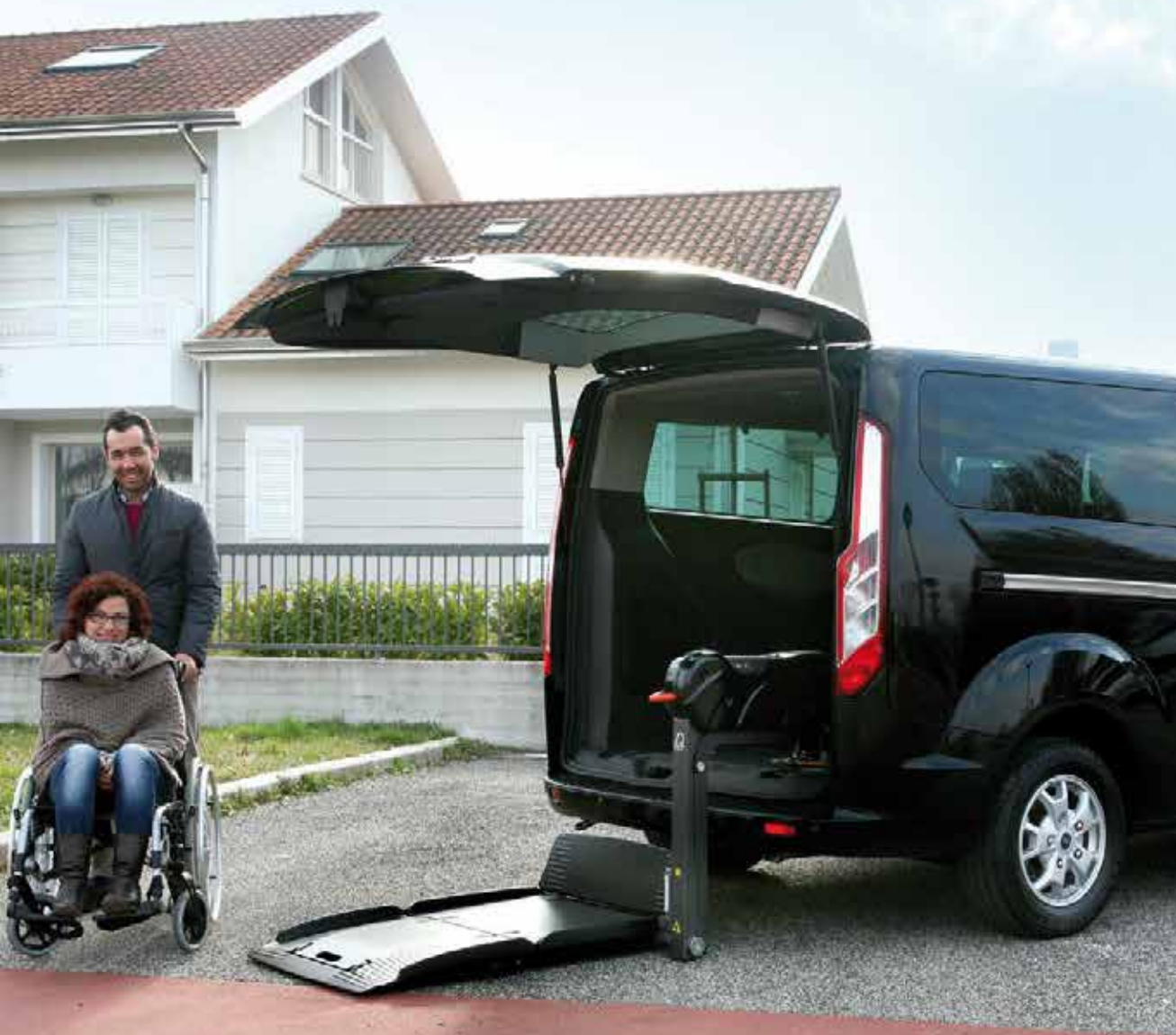
Foto: Ford Tourneo Custom con sollevatore Fiorella

Un mix perfetto di amore e tecnologia trasforma i prodotti Focaccia in prodotti speciali.