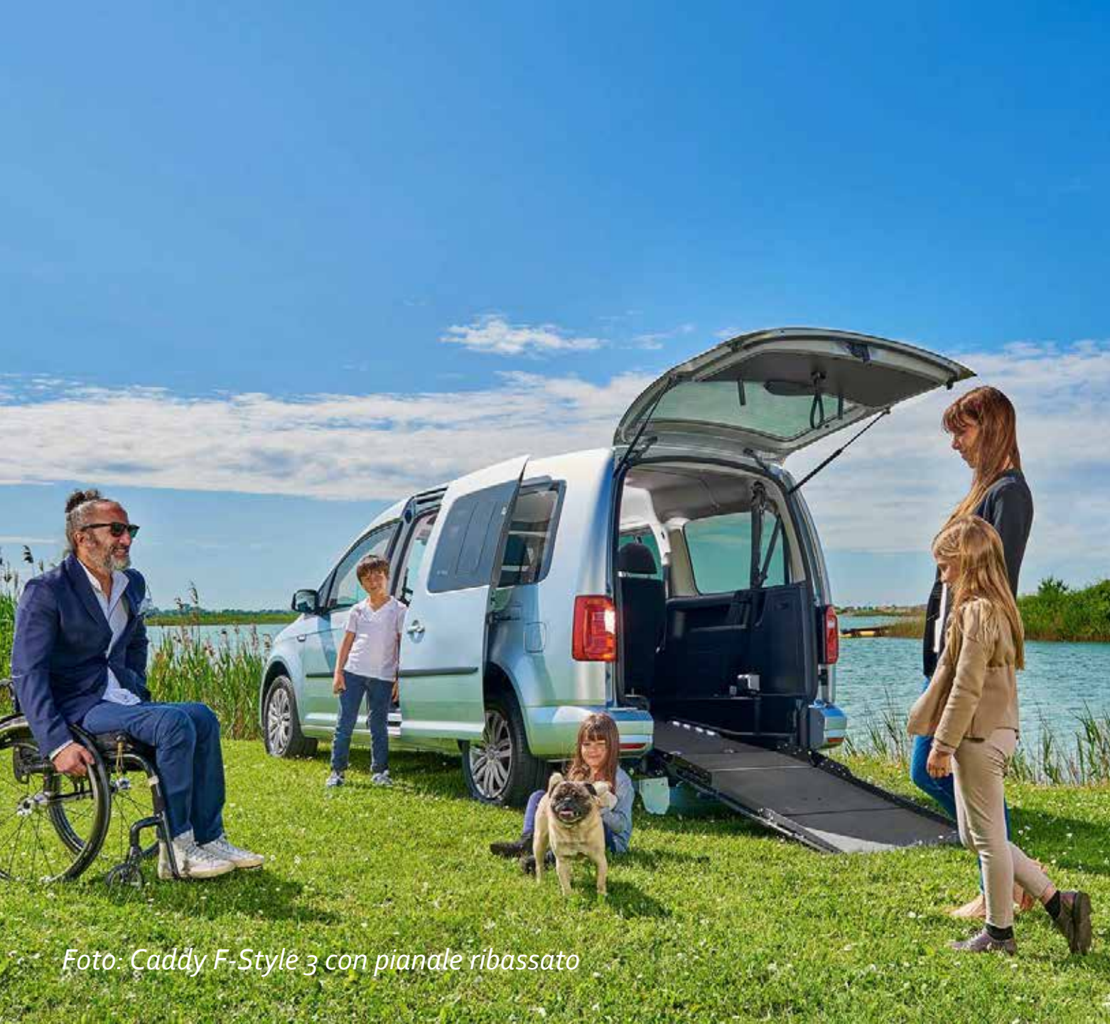
Foto: Caddy F-Style 3 con pianale ribassato

Ogni giorno ci sono persone che lavorano per dare qualcosa in più alle nostre auto. Uomini e donne che sanno come migliorare il mondo che ci circonda attraverso progetti innovativi, design all'avanguardia e soluzioni pronte a rendere più semplice e accessibile la nostra vita. Una visione del mondo trasversale, che parte da una semplice idea e arriva fino al prodotto finito, con una passione tutta italiana per le cose belle e per la qualità costruita a regola d'arte. Focaccia Group, da oltre 60 anni, è specializzata nella progettazione e costruzione di soluzioni che superano i limiti delle normali automobili. Nata con l'amore artigiano di una Carrozzeria, oggi Focaccia è una realtà globale presente in oltre 50 paesi del mondo con tre sedi operative in Italia, Svizzera e Brasile .